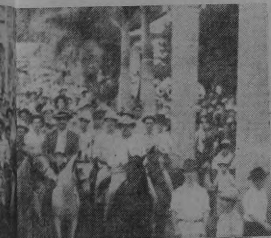
Esta gráfica presenta una vista que da idea parcial de la inmensa muchedumbre que se congregó para oír la voz del futuro Presidente de Costa Rica don José Figueres