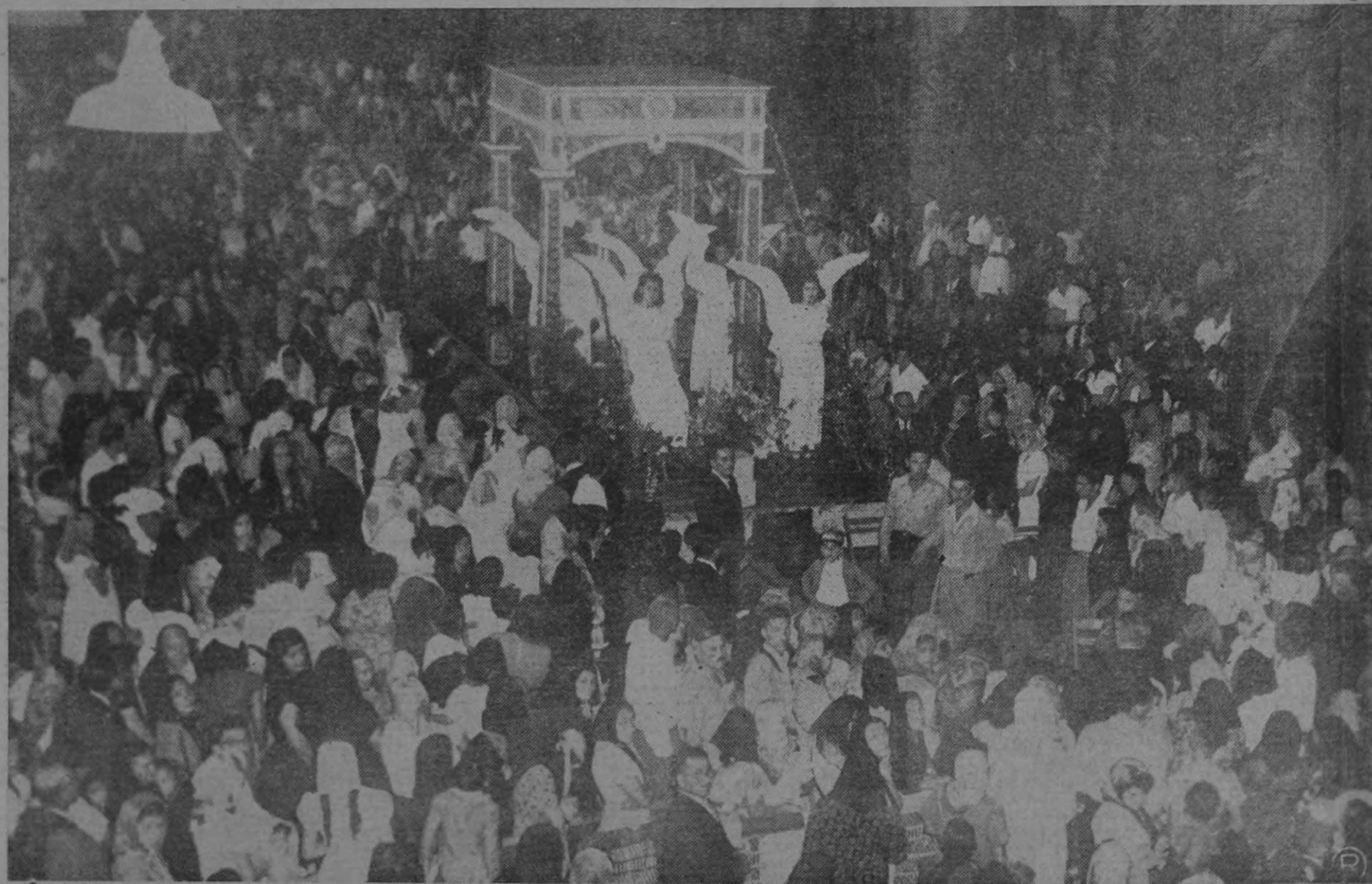
CEREMONIA EN EL FERROCARRIL. — En los talleres del Ferrocarril Eléctrico al Pacífico, una abigarrada multitud recibe la imagen del Corazón de Jesús, que rodeada de niñas vestidas de ángeles, fué traída en un carro plano, en tren especial, desde Puntarenas, en acto de piedad religiosa de los empleados del ferrocarril. — emergencia. Otra