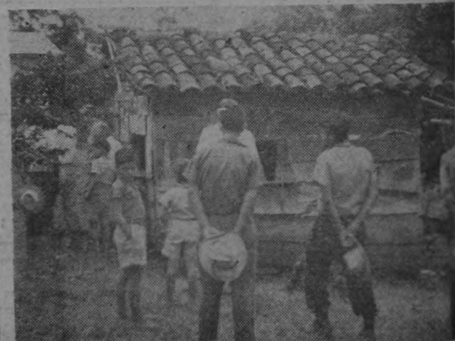
Esta era la vieja escuela de La Guácima (Atenas). El Presidente Ulate inauguró el domingo una nueva.— (Foto GONZALEZ CAMPO).