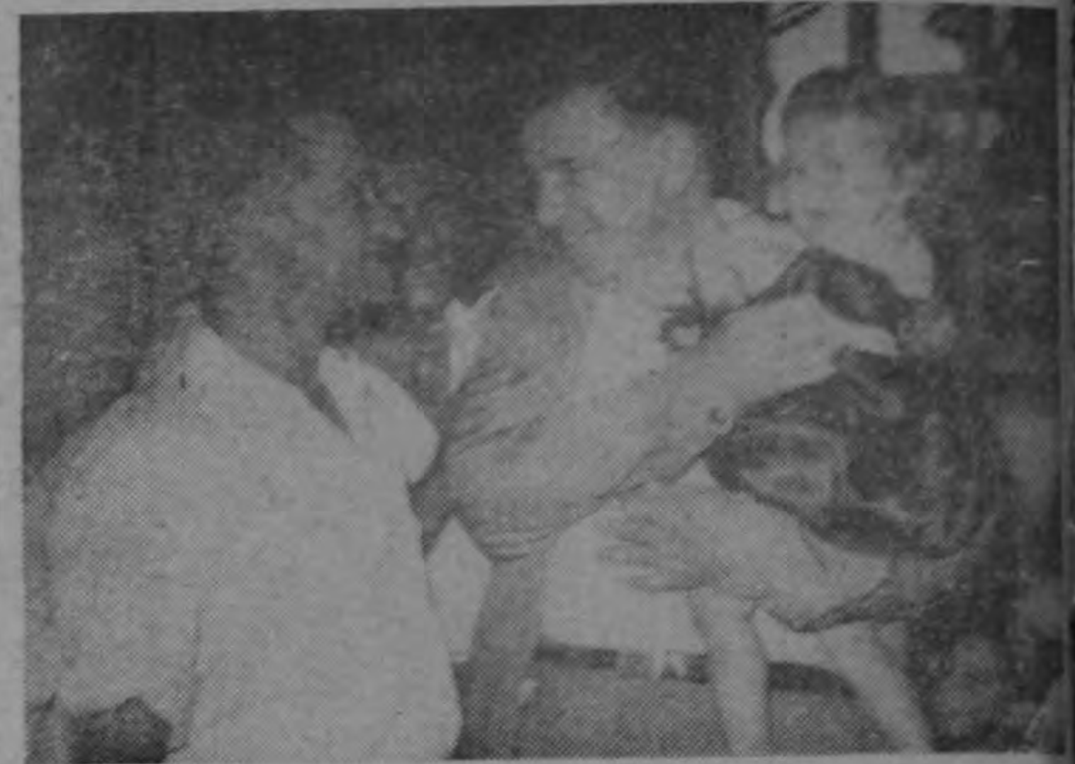
Sonriente, el Presidente Ulate toma en sus brazos a una niña campesina. Esto, durante la inauguración de la Escuela de Sabana Grande (Atenas).