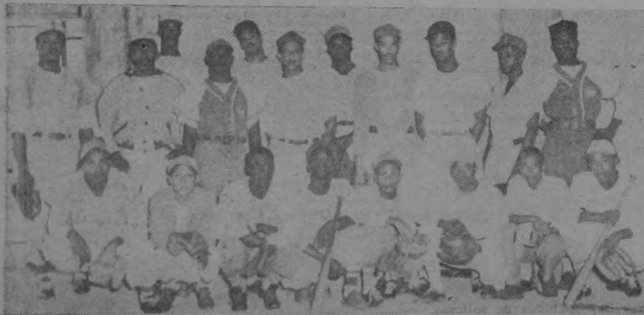
La Selección Limonense, que empató la serie beisbolera contra la Selección Josefina, ganando el primer juego por 7 carreras contra 1, y perdiendo luego el segundo por 17 contra 8.—(FOTO SOLANO).