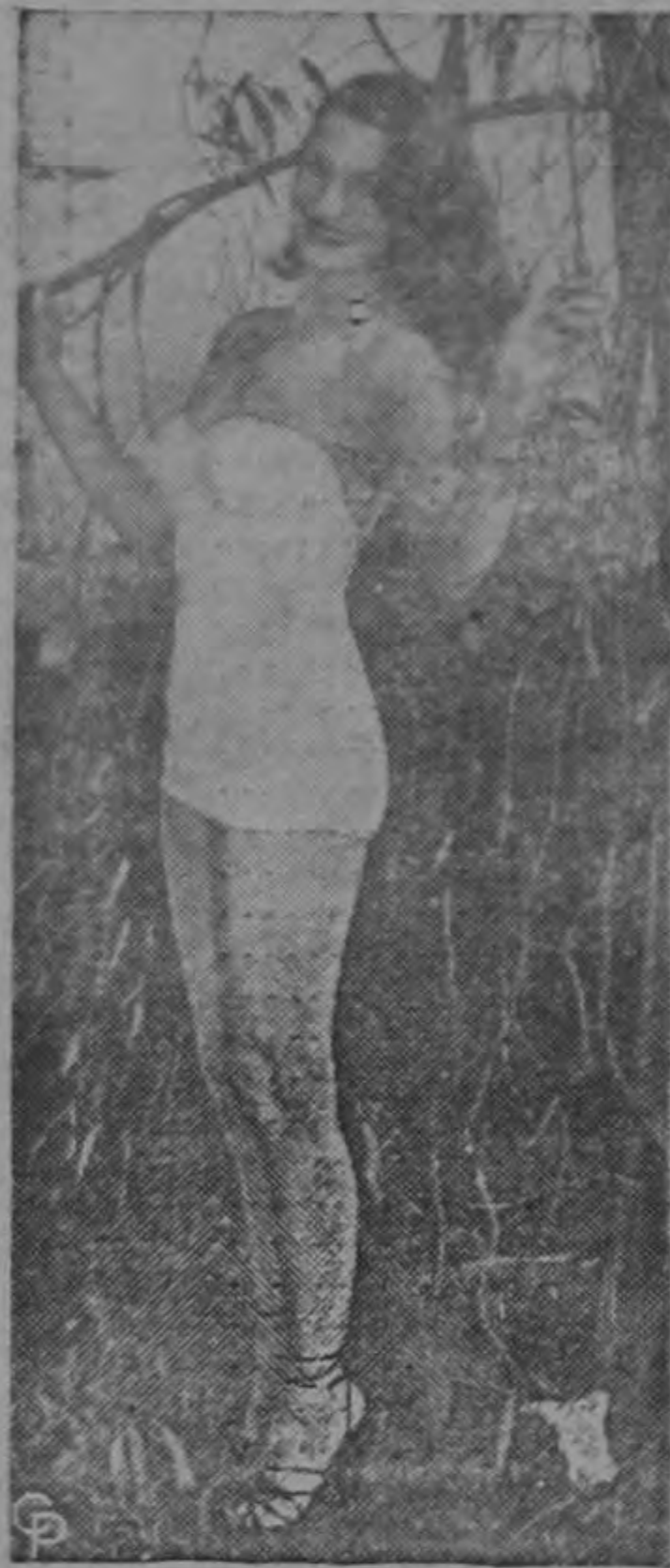
June McCall, modelo de 17 años, aparece aquí en Hollywood donde ha comenzado a aparecer en el cinematógrafo.