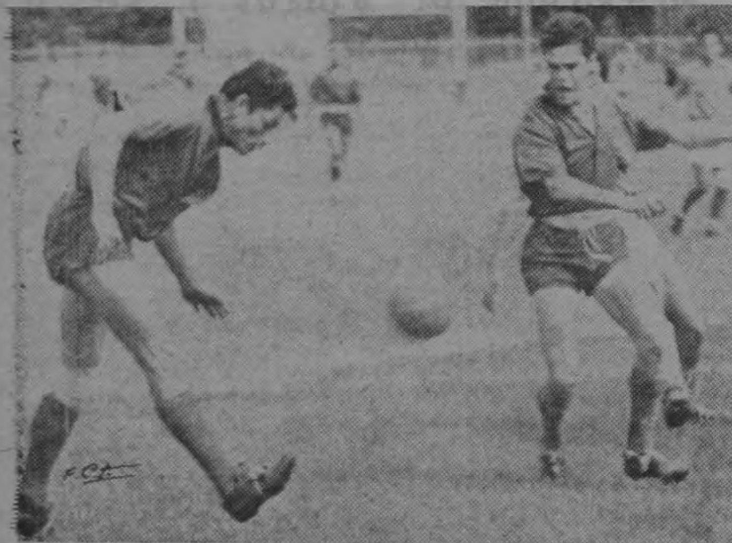
Un momento emocionante en el juego San Luis-Turcios, con que culminó el campeonato de los barrios, que adquirió el Turcios al derrotar a su rival por 3 a 1.—(FOTO COTO).