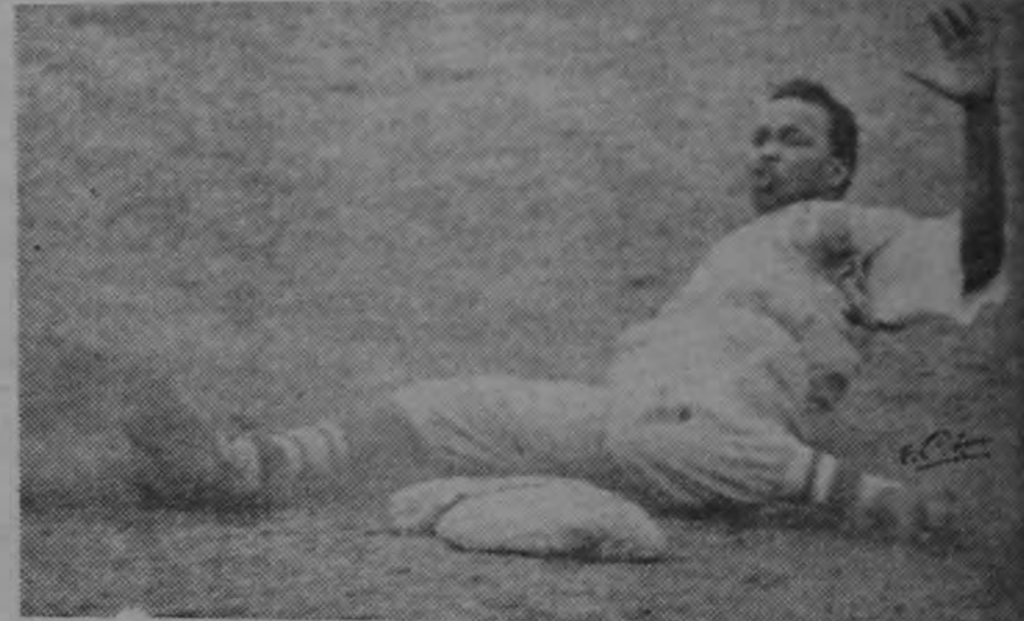
Blake, de Limón, en el segundo juego de la serie beisbolera Limón-San José, celebrada el domingo y que resultó empatada.

Se cree que su ingreso a esta capital se producirá el jueves o viernes de la presente semana.