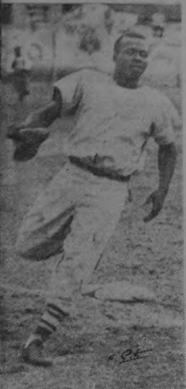
Con agilidad de gacela, un jugador limonense interviene durante la serie jugada por la selección de ese puerto contra la de San José, en el Parque de Béisbol, y que resultó empatada al ganar Limón el primer juego y San José el segundo.

11.—Turner sale atacando con gran rapidez y cruza el ring, lanzando swings al avanzar. Tira seis izquierdos derechos a la cabeza de Gavilán con la velocidad del rayo y el Kid le responde con un derecho izquierdo. Turner otra vez comienza a lanzar swings casi perdiendo el equilibrio al errar un derechazo. Gavilán conecta un derechazo de arriba a abajo en la cabeza. En seguida tira un izquierdo, un terrible derecho y otro derecho, haciendo que Turner esté sin poderse defender contra las cuerdas. Gavilán golpea y golpea y hace retroceder a Turner. Turner gira como autómatas alrededor del ring. Se sujeta de las cuerdas y el referi lo agarra. Así terminó la pelea. El knockout se registró a los dos minutos y cuarenta y siete segundos del undécimo round.