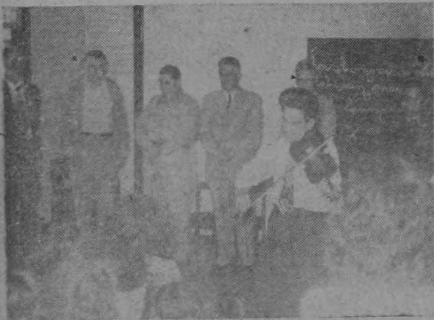
Con acompañamiento de violín, los niños de la Escuela de La Guácima, (Atenas), cantan el Himno Nacional, y el Presidente Ulate y su comitiva, que incluye al Ministro de Educación Chaverri, escuchan. Todo, durante la inauguración de la Escuela, el domingo 6.—(Foto González Ocampo).