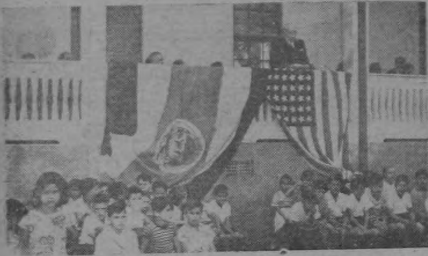
Como todos los años, el Embajador Americano concurrió el 4 de julio a la Escuela Estados Unidos de América, de San Joaquín de Flores. Este año tocó al General Phillip Fleming presenciar los lucidos actos escolares.