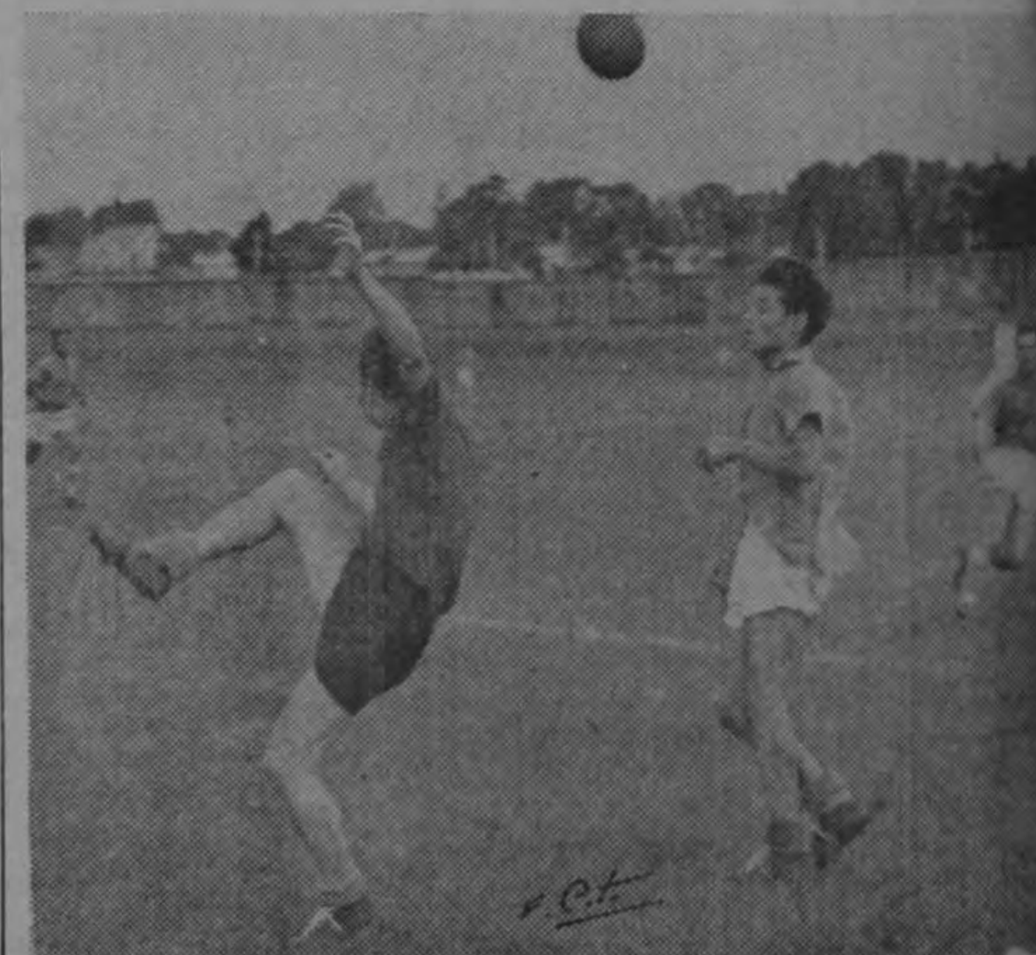
El Turcios se consagró el domingo campeón de los barrios al derrotar al San Luis por 3 a 1. Un momento del juego en el Estadio Nacional.