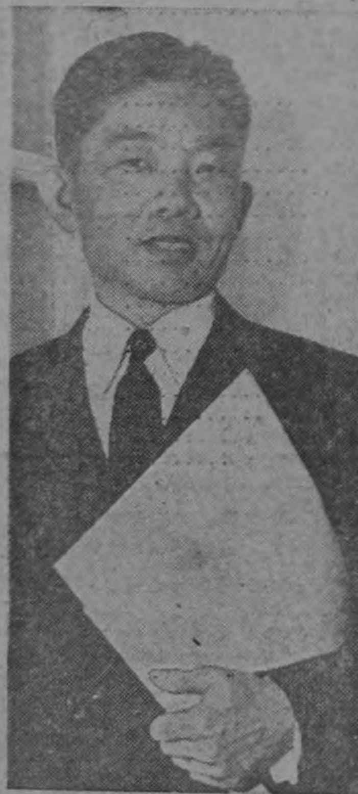
Nong Kimny, nuevo Embajador de Cambodia en los Estados Unidos, sujeta sus credenciales al llegar a la Casa Blanca a fin de presentarlas al Presidente Truman.