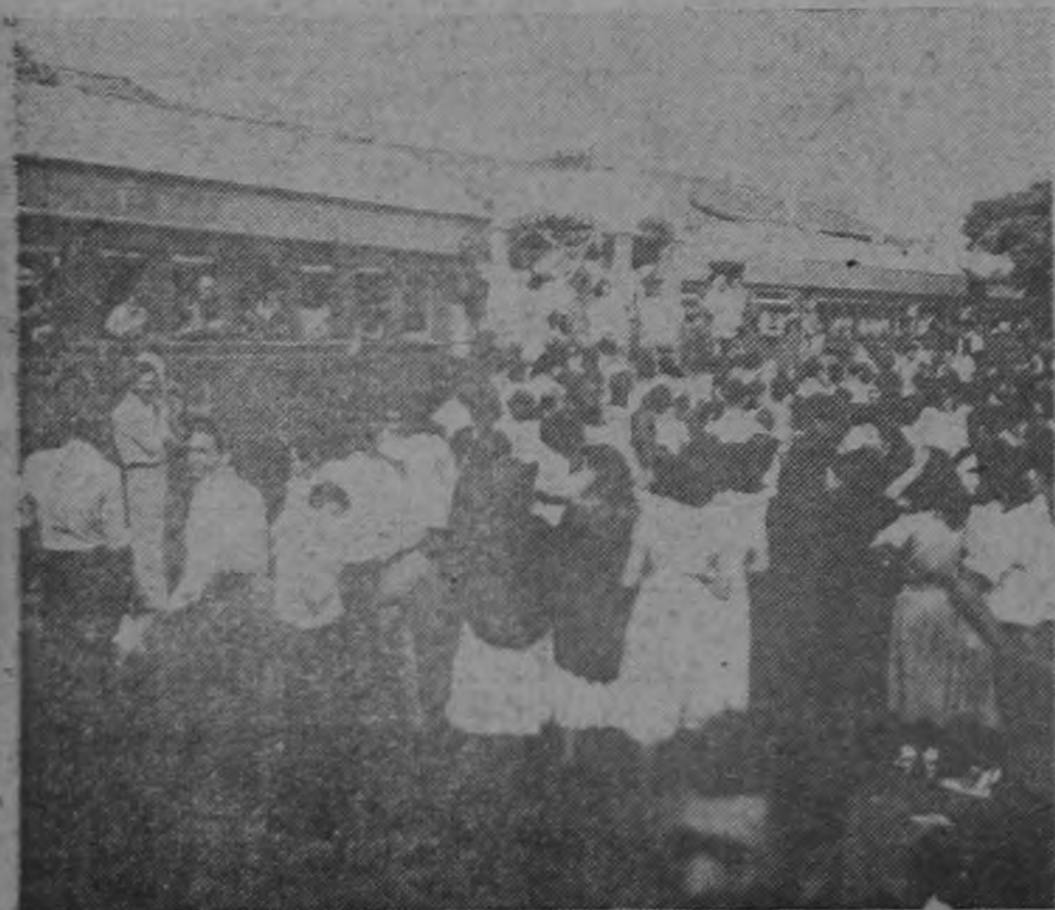
La imagen del Corazón de Jesús, que un tren trajo el domingo desde Puntarenas hasta los talleres del Ferrocarril Eléctrico al Pacífico, hace un alto en una de las estaciones.