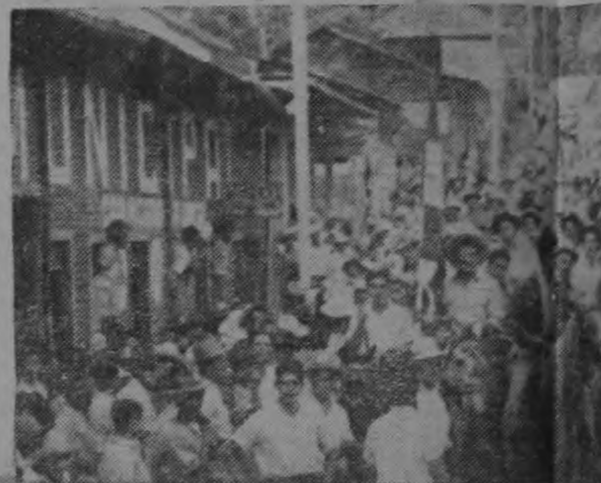
150 jinetes acompañaron a don José Figueres en su entrada triunfal a San Ignacio de Acosta

El pueblo le ha llamado para garantizar de sus más finas y serenas honradez acrisolada, de la que presenta el mayor obstáculo para la erradicación del comunismo germinal en nuestro pueblo. Representa el camino de los problemas nacionales, de la justicia social con libertad.